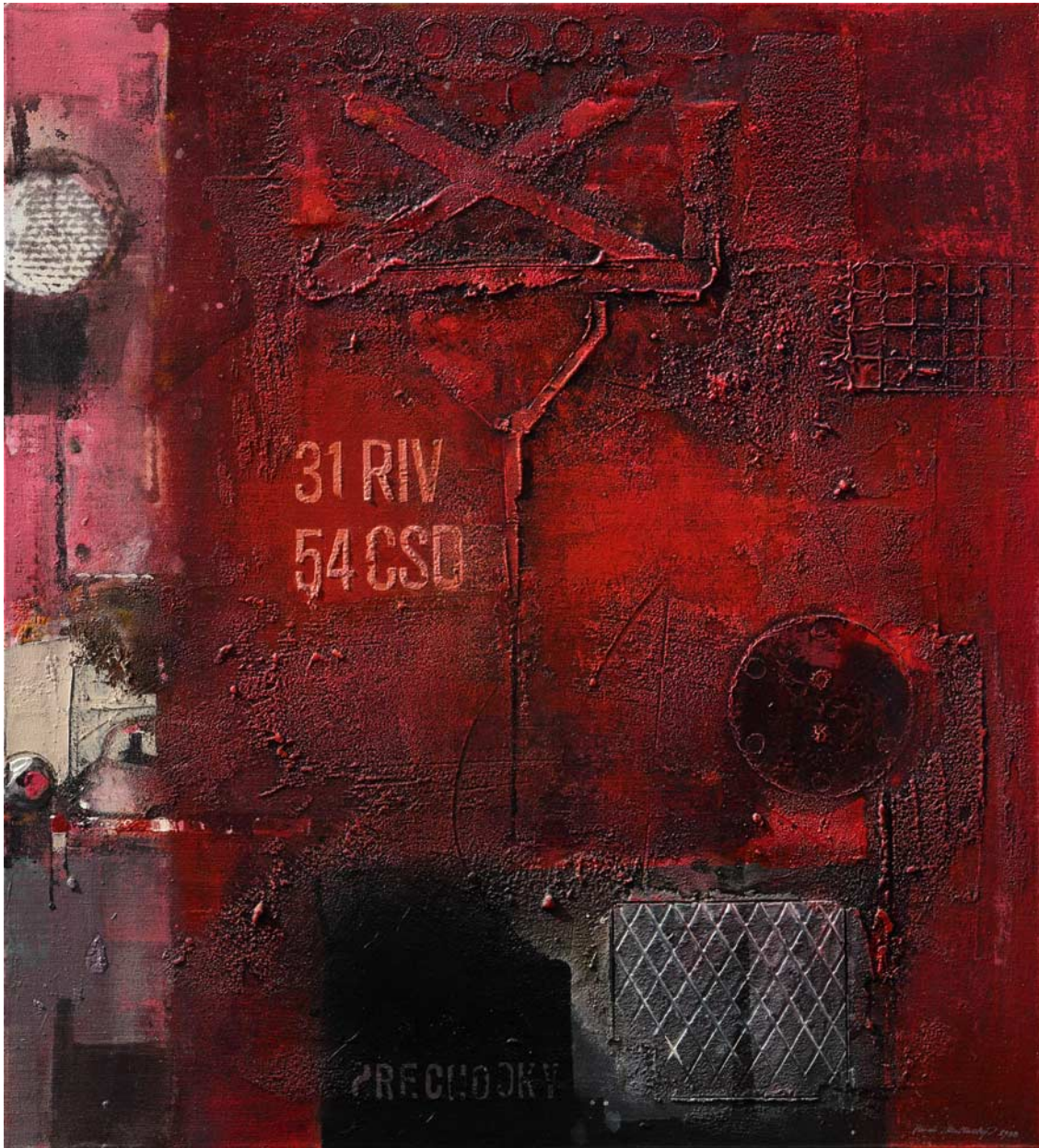
Nádraží na předměstí olej, plátno, 100 x 90 cm, 1988