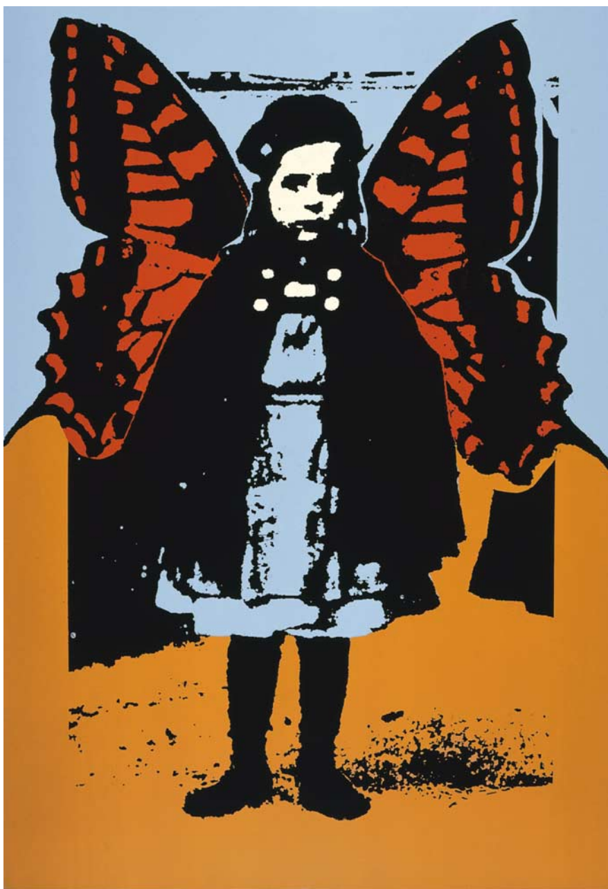
Dívka motýl serigrafie, papír, 100 x 70 cm, 2000