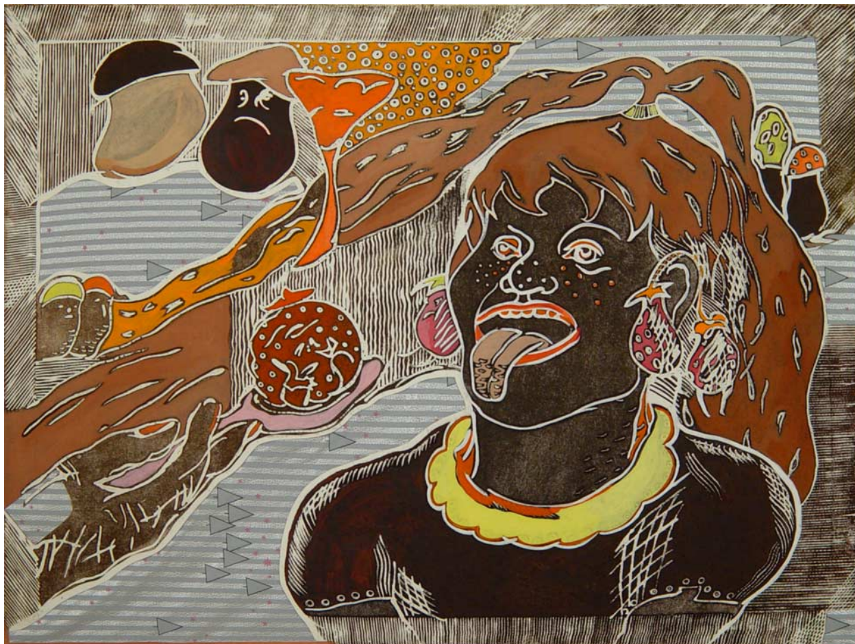
Bruneta lept, koláž, papír, 60 x 84 cm, 1992