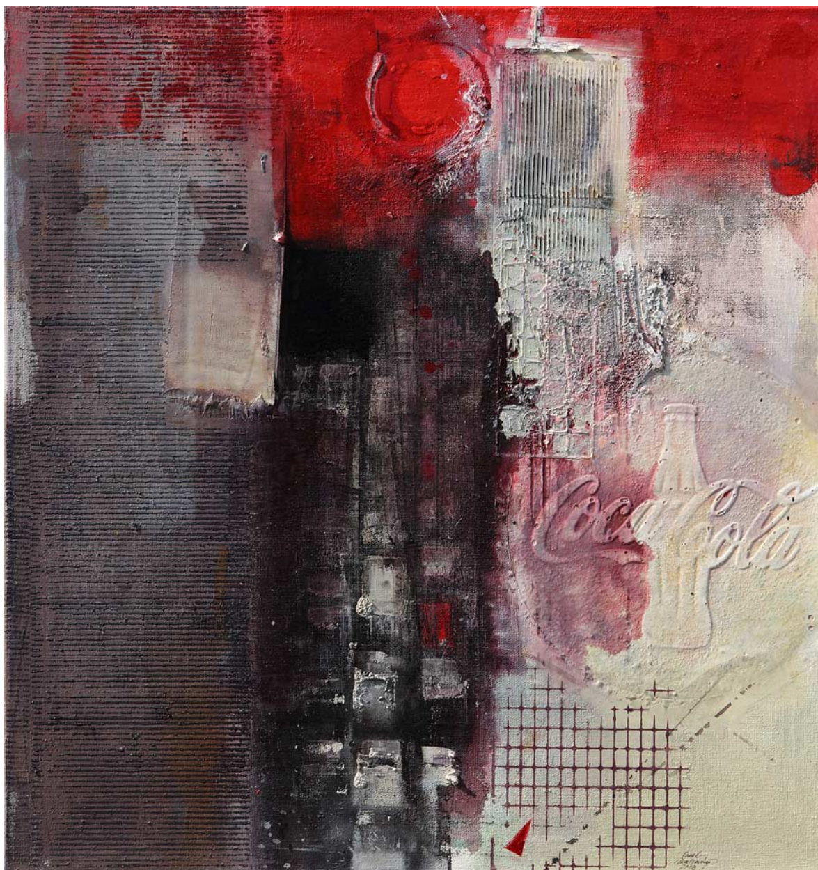
Transfer neznámou megapolí olej, plátno, 100 x 95 cm, 2018