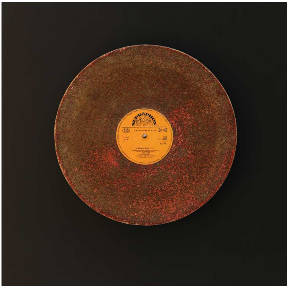
Hodně obehnaná, obroušená deska Vladimíra Mišíka překližka, lak, brusný kotouč, kov, papír, tisk, 51 x 51 cm, 2008