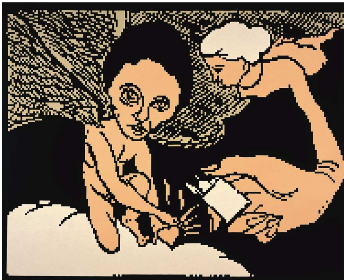
Amorek serigrafie, papír, 70 x 100 cm, 2001