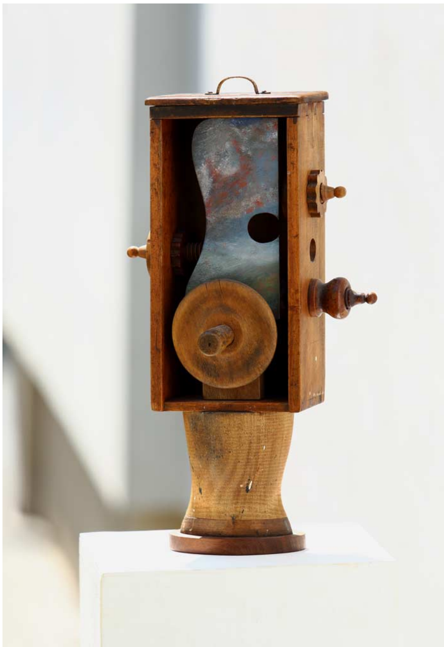
Zdravice L. Fáy dřevo, překližka, kov, olejomalba, lak, v. 51 cm, 2016