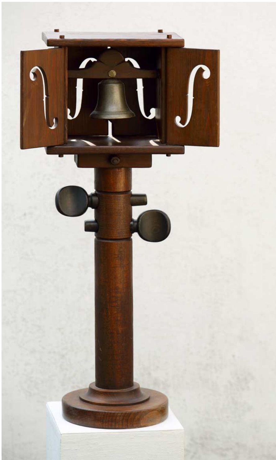
Zvonice dřevo, lak, kov, v. 97,5 cm, 2014