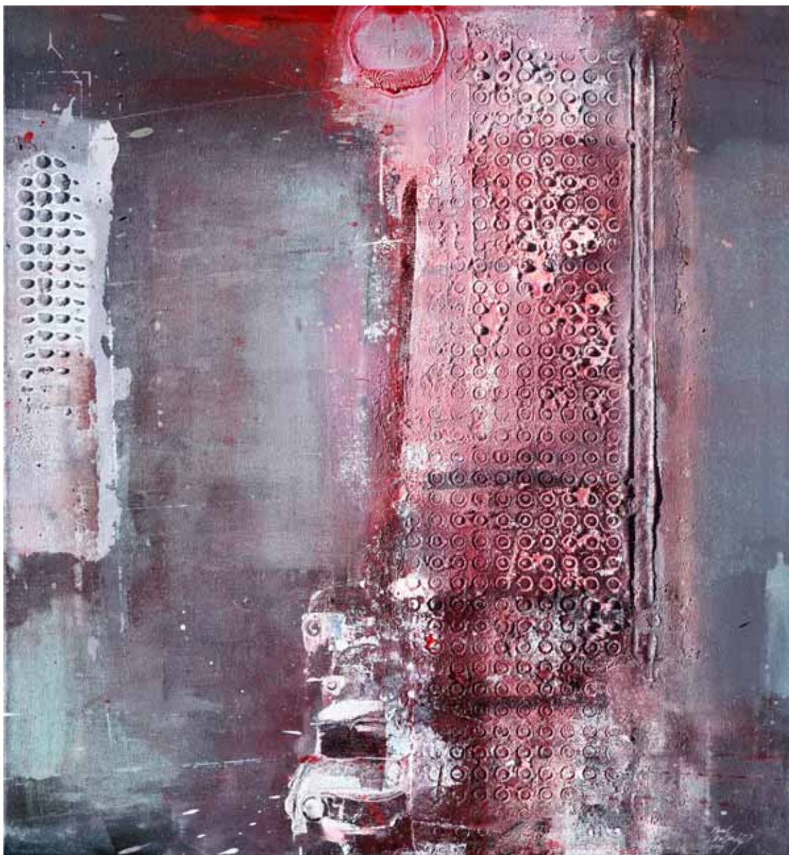
Město mezi dnem a nocí olej, plátno, 100 x 90 cm, 2019