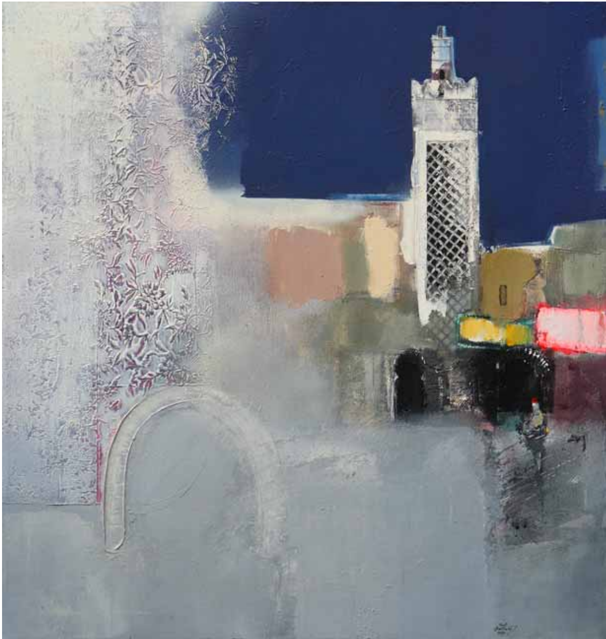
Fez akryl, olej, plátno, 100 x 95 cm, 1994