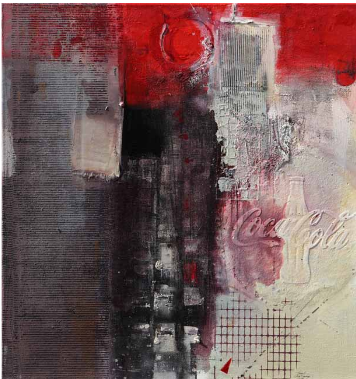
Transfer neznámou megapolí olej, plátno, 100 x 95 cm, 2018