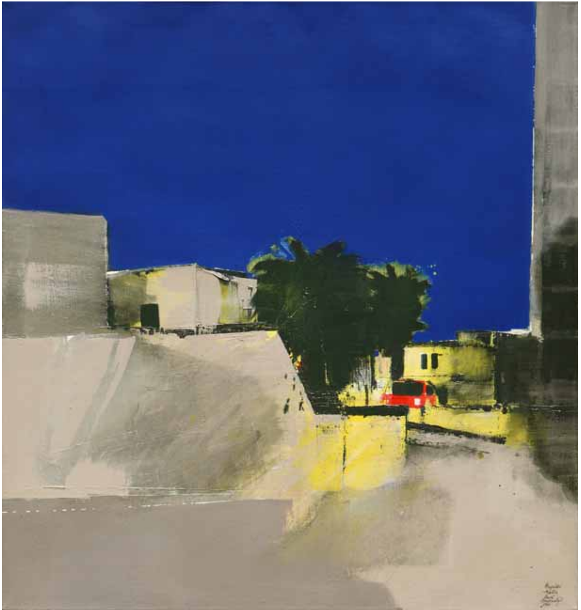
Bugibba - Malta olej, plátno, 100 x 95 cm, 1989