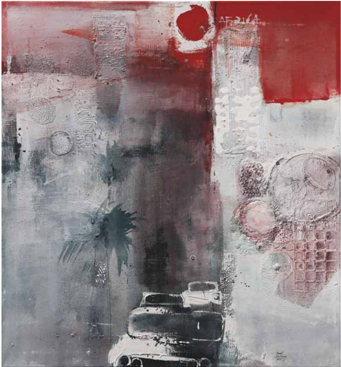
Avenue HB olej, plátno, 100 x 90 cm, 2015