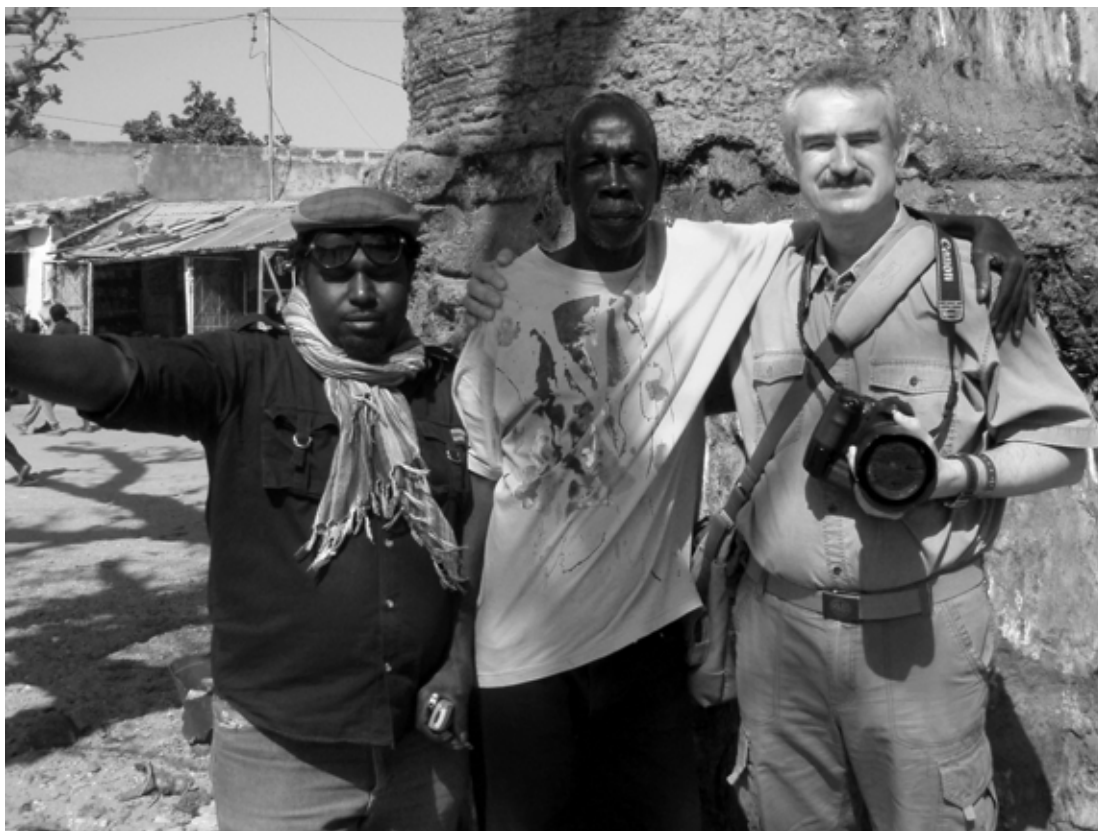
Sénégal 2013, Nbour - Saly, uprostřed vesnice ve stínu staletého baobabu, snímek na rozloučenou s muži ze společnosti obchodující s africkým uměním

Rozmlouval a záznam pořídil 3. března 2019 Mgr. Václav Voříšek