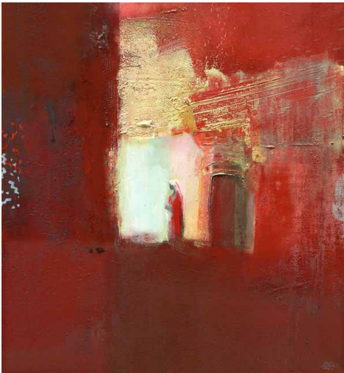
Poledne v Marrákeši olej, plátno, 100 x 90 cm, 2019