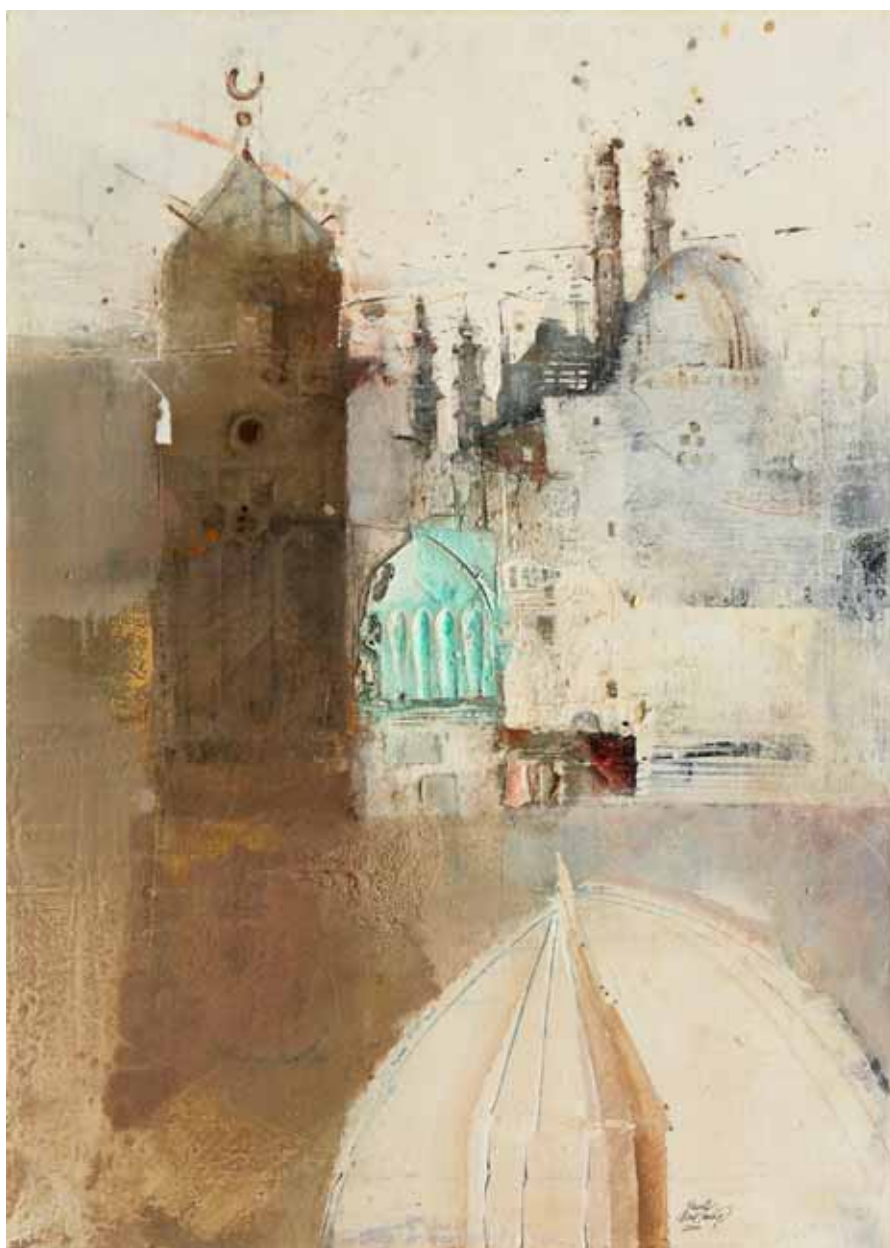
Minarety (Stará Káhira) olej, plátno, 70 x 50 cm, 2000