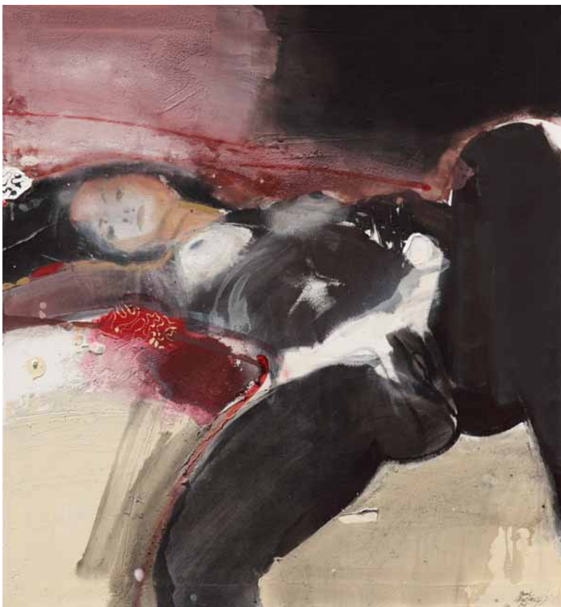
Tropická noc akryl, olej, plátno, 100 x 90 cm, 2015