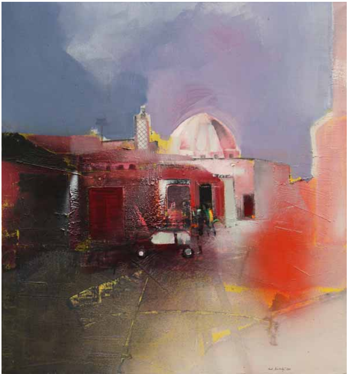
Marrákěš akryl, olej, plátno, 100 x 90 cm, 1994